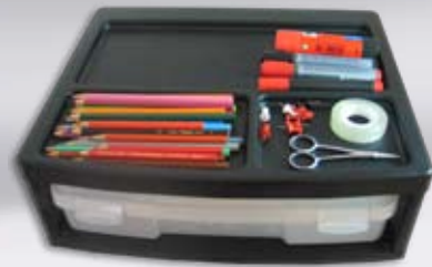
PJC 303/304 mit Ablagefächern oben