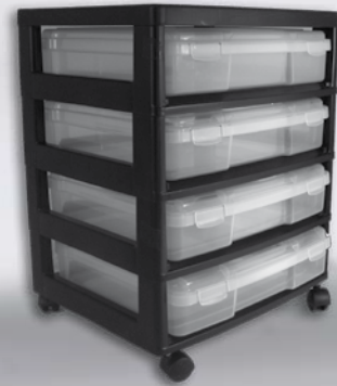
PJC 304 mit herausnehmbaren Boxen