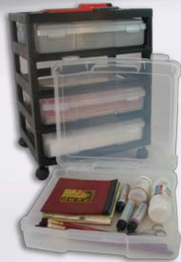
PJC 304 mit einer geöffneten Box