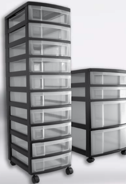
NMC 010 + NMC 322